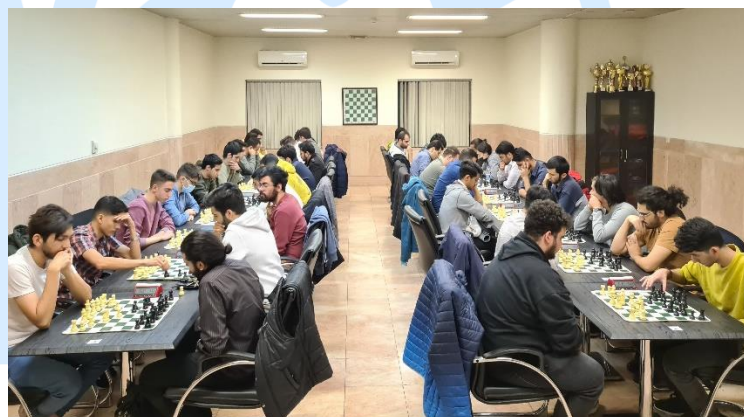
۴- مسابقات شطرنج قهرمانی دانشگاه شریف گروه آقایان - آذر ۱۴۰۱