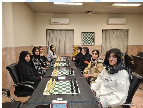
۵- مسابقات شطرنج قهرمانی دانشگاه شریف گروه بانوان - آذر ۱۴۰۱