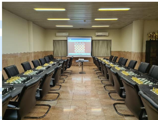
۲- استفاده از ویدیو پروژکتور و پرده برای قابلیت برگزاری همزمان کلاس‌های حضوری و آنلاین