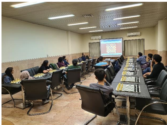
۳- برگزاری کلاس‌ها با حضور شرکت کنندگان - آبان ۱۴۰۲